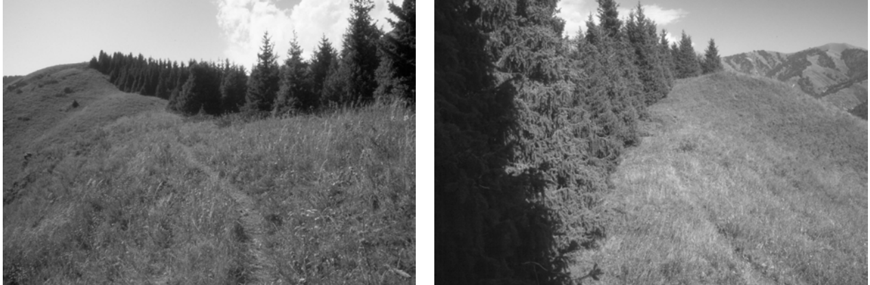
Abbildungen 2a,b: Expositionsbedingter Waldrand entlang eines Hangrückens zwischen einem nordexponierten Tienschanfichten-Wald ( Picea schrenkiana ) und einer südexponierten Steppe in der montanen Fichtenwald-Steppen-Wiesensteppen-Stufe im nordöstlichen Issyk-Kul-Gebiet..

dass die Vegetationsunterschiede und damit die Waldgrenze nicht allein anthropogen bedingt sein können. Um derartige Aussagen treffen zu können, ist es wichtig, dass der Standort geostrukturell erfasst wird, und nicht nur die chemischen Eigenschaften des Wurzelhorizontes analysiert werden, welcher nur Aussagen über den aktuellen, veränderbaren Zustand des Oberbodens liefern.